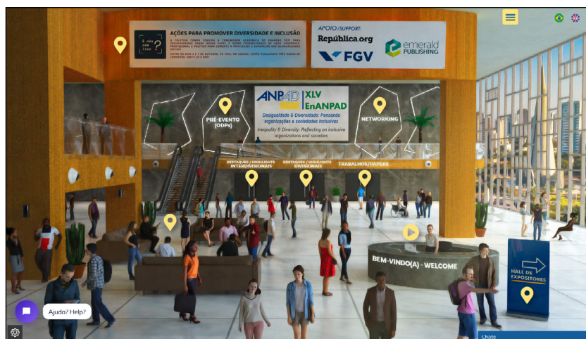
Figura 1. Vista da plataforma virtual de realização do evento.

Como resultado do evento, foram publicados 1.621 trabalhos nos anais eletrônicos do evento, que contou com 2.311 participantes. Os autores dos melhores trabalhos de cada divisão da ANPAD foram premiados, recebendo fast track para a publicação no periódico BAR - Brazilian Administration Review ou na RAC (Revista de Administração)